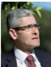
ΑΡΘΡΟ του Άγγελου Τσιγκρή Διδάκτορα Εγκληματολογίας

Ο Άγγελος Τσιγκρής έχει διατελέσει εκπρόσωπος της Ελλάδας στη Μόνιμη Επιτροπή Επιχειρησιακής Συνεργασίας για την Εσωτερική Ασφάλεια στην Ευρώπη (COSI) του Συμβουλίου της ΕΕ και στη Μόνιμη Αντιπροσωπία του ΟΗΕ για την Πρόληψη του Εγκλήματος και την Ποινική Δικαιοσύνη.