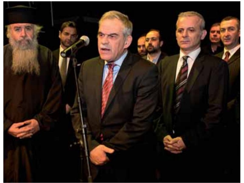
δυσκολίες και το έργο των αστυνομικών, ενώ σύντομο χαιρετισμό απεύθυνε

Από τη μεριά του ο Υπουργός στο σύντομο χαιρετισμό του αναγνώρισε τις