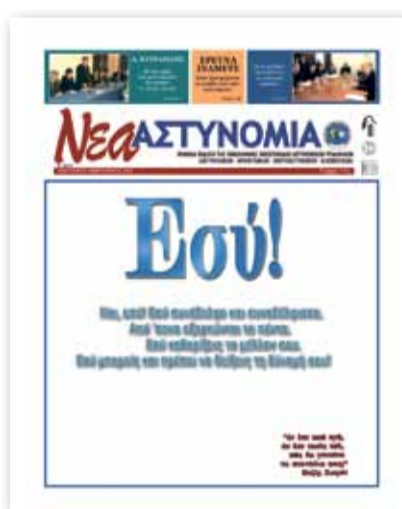
Το πρωτοσέλιδο της Νέας Αστυνομίας (τεύχος 11, Ιανουάριος 2007) με τον χαρακτηριστικό τίτλο «Εσού!». Διαρκής η προσπάθειά μας για την εμπέδωση της συνδικαλιστικής συνείδησης στα μέλη μας

αστυνομικούς με τα τόσα προβλήματά τους και όχι την ολιγάριθμη συντεχνία του;