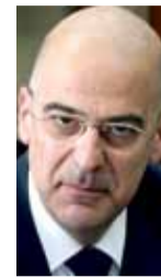
Νίκος Δένδιας ΥΠΟΥΡΓΟΣ ΔΗΜΟΣΙΑΣ ΤΑΞΗΣ & ΠΡΟΣΤΑΣΙΑΣ ΤΟΥ ΠΟΛΙΤΗ

Αυτό που συνέβη εδώ (σ.σ. Νέα Μανωλάδα), όχι μόνο αντίκειται στη νομιμότητα, αντίκειται ευθέως στην ιδέα της ανθρωπιάς. Είναι παντελώς απαράδεκτο και δεν έχει καμία σχέση με την ευρύτερη κουλτούρα του ελληνικού λαού και της ελληνικής κοινωνίας.