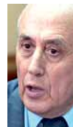
Αντώνης Ρουπακιώτης ΥΠΟΥΡΓΟΣ ΔΙΚΑΙΟΣΥΝΗΣ

Αυτό που συνέβη εδώ (σ.σ. Νέα Μανωλάδα), όχι μόνο αντίκειται στη νομιμότητα, αντίκειται ευθέως στην ιδέα της ανθρωπιάς. Είναι παντελώς απαράδεκτο και δεν έχει καμία σχέση με την ευρύτερη κουλτούρα του ελληνικού λαού και της ελληνικής κοινωνίας.