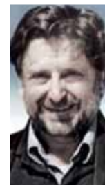
Νίκος Μουζέλλης ΟΜΟΤΙΜΟΣ ΚΑΘΗΓΗΤΗΣ LSE

Εφόσον, λιγότερο ή περισσότερο, υπήρξαμε όλοι μέρος της κρίσεως, μπορούμε να γίνουμε μέρος της αλλαγής. Έχουμε και τη δυνατότητα και το καθήκον να συμβάλλουμε στη διαμόρφωση της υγιέστερης κοινωνίας που όλοι επιθυμούμε και οραματιζόμαστε.