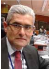
Του ΑΓΓΕΛΟΥ ΤΣΙΓΚΡΗ

Η α πρέπει να πάψουμε να συγχέουμε τους παράνομους μετανάστες που εισέρχονται λαθραία στην επικράτεια ενός κράτους, με τους πρόσφυγες που νόμιμα ζητούν άσυλο.