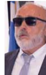
Π. Κουρουμπλής ΥΠΟΥΡΓΟΣ ΕΣΩΤΕΡΙΚΩΝ ΚΑΙ ΔΙΟΙΚΗΤΙΚΗΣ ΑΝΑΣΥΓΚΡΟΤΗΣΗΣ

Είμαστε γνώστες των οικονομικών προβλημάτων του χώρου και αντιλαμβανόμαστε ότι καλούνται άνθρωποι, οι οποίοι ρισκάρουν και τη ζωή τους, να δουλεύουν με πολύ χαμηλούς μισθούς. Εδώ λοιπόν είναι το κρίσιμο ζήτημα και για αυτή την Κυβέρνηση: πως θα συμβάλει ώστε αυτή η συνεχώς διευρυνόμενη τα τελευταία χρόνια οικονομική ανισότητα, θα αναστραφεί.