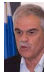
Νικόλαος Τόσκας ΑΝΑΠΛΗΡΩΤΗΣ ΥΠΟΥΡΓΟΣ ΠΡΟΣΤΑΣΙΑΣ ΤΟΥ ΠΟΛΙΤΗ

Είμαστε γνώστες των οικονομικών προβλημάτων του χώρου και αντιλαμβανόμαστε ότι καλούνται άνθρωποι, οι οποίοι ρισκάρουν και τη ζωή τους, να δουλεύουν με πολύ χαμηλούς μισθούς. Εδώ λοιπόν είναι το κρίσιμο ζήτημα και για αυτή την Κυβέρνηση: πως θα συμβάλει ώστε αυτή η συνεχώς διευρυνόμενη τα τελευταία χρόνια οικονομική ανισότητα, θα αναστραφεί.