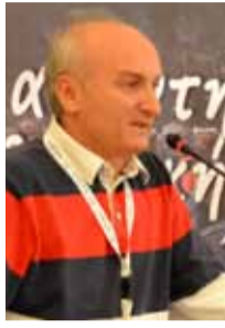
Του ΣΤΕΡΓΙΟΥ ΜΠΑΝΤΟΛΑ

Για να γίνει μία αναλογιστική μελέτη, χρειάζονται τουλάχιστον τρία οικονομικά έτη. Η περυσινή αναλογιστική μελέτη έλαβε υπ' όψη τα στοιχεία των ετών 2010, 2011, 2012, 2013, η φετινή αναλογιστική μελέτη έλαβε υπ' όψη τα στοιχεία των ετών 2011, 2012, 2013. Από την σύγκριση των οι-