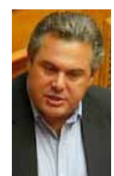
Πάνος Καμμένος ΠΡΟΕΔΡΟΣ ΤΩΝ ΑΝΕΛ ΥΠΟΥΡΓΟΣ ΥΕΘΑ

Εισάγουμε νέο δόγμα για την ασφάλεια, τις ελευθερίες, τα δικαιώματα, τις σχέσεις Αστυνομίας-πολίτη. Η Αστυνομία δεν θα έχει το ρόλο της καταστολής των λαϊκών κινητοποιήσεων. Η Αστυνομία θα εγγυάται την προστασία του πολίτη από το έγκλημα. Η Αστυνομία θα εγγυάται την ασφάλεια των πολιτών. Στο πλαίσιο αυτό επαναφέρουμε το θεσμό του «αστυνομικού της γειτονιάς». Αναβαθμίζουμε και εκσυγχρονίζουμε την εκπαίδευση των αστυνομικών, το status και τις συνθήκες εργασίας τους.