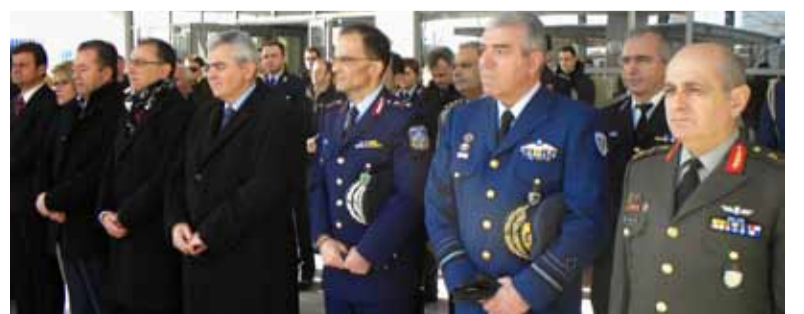
Τα στιγμιότυπα είναι από τις εκδηλώσεις μνήμης της Συνδικαλιστικής Ένωσης Αστυνομικών Υπαλλήλων Αλεξανδρούπολης, της Ένωσης Αστυνομικών Υπαλλήλων Ροδόπης και της Ένωσης Αστυνομικών Λάρισας.