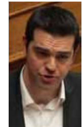
Αλέξης Τσίπρας ΠΡΩΘΥΠΟΥΡΓΟΣ

Εισάγουμε νέο δόγμα για την ασφάλεια, τις ελευθερίες, τα δικαιώματα, τις σχέσεις Αστυνομίας-πολίτη. Η Αστυνομία δεν θα έχει το ρόλο της καταστολής των λαϊκών κινητοποιήσεων. Η Αστυνομία θα εγγυάται την προστασία του πολίτη από το έγκλημα. Η Αστυνομία θα εγγυάται την ασφάλεια των πολιτών. Στο πλαίσιο αυτό επαναφέρουμε το θεσμό του «αστυνομικού της γειτονιάς». Αναβαθμίζουμε και εκσυγχρονίζουμε την εκπαίδευση των αστυνομικών, το status και τις συνθήκες εργασίας τους.