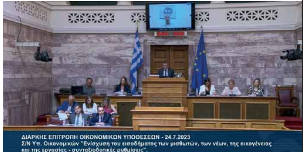
ΔΙΑΡΚΗΣ ΕΠΙΤΡΟΠΗ ΟΙΚΟΝΟΜΙΚΩΝ ΥΠΟΘΕΣΕΩΝ - 24.7.2023 Σ/Ν Υπ. Οικονομικών "Ενίσχυση του εισοδήματος των μισθωτών, των νέων, της οικογένειας και της εργασίας - συνταξιοδοτικές ρυθμίσεις".

«Κύριε Υπουργέ, Κύριε Πρόεδρε της Επιτροπής, Κυρίες και Κύριοι Βουλευτές Στο λιγιστό χρόνο που έχω στη διάθεσή μου, θα σταθώ στα βασικά αιτήματά μας, αλλά θα σας παρακαλέσω να δείτε με προσοχή τις παρατηρήσεις μας, όπως αυτές αναρτήθηκαν και στη διαβούλευση. Κατ' αρχάς επιτρέψτε μου κ. Υπουργέ να επισημάνω ότι οι ρυθμίσεις για τους αστυνομικούς, προωθούνται σε νομοσχέδιο για το Δημόσιο και όχι με νομοσχέδιο για το ειδικό μισθολόγιο Ενόπλων Δυνάμεων και Σωμάτων Ασφαλείας. Είναι φυσικά καλοδεχούμενες, αφού κάθε επιπλέον ευρώ στις αποδοχές μας, έρχεται να γιατρέψει πληγές. Αυτές όμως απέχουν πολύ από τις προεκλογικές δεσμεύσεις της κυβέρνησης. Θα ψηφίσετε λοιπόν επί μέρους αλλαγές του βασικού μισθού, όπως γίνεται με το άρθρο 20 και την ορίζοντα αύξηση των 70 ευρώ μεικτά, και κάποιες αναπροσαρμογές συγκεκριμένων επιδομάτων. Στο άρθρο 21 προβλέπονται οικογενειακές παροχές. 70 ευρώ δίνονται μικτά. Ξέχασε όμως ο νομοθέτης ότι στην αστυνομία εισέρχονται σε ηλικία 18 ετών και για ένα μεγάλο χρονικό διάστημα δεν υπάρχουν έγγαμοι είτε με τέκνα. Άρα