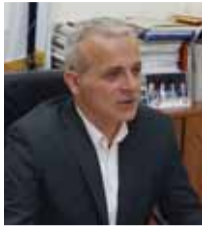
Του Γρηγόρη Γερακαράκου Προέδρου της Π.Ο.ΑΣ.Υ.

Ε χει εδραιωθεί η αίσθηση ότι την ανασφάλεια των πολιτών την προκαλεί η εγκληματικότητα λόγω απουσίας ή ανεπάρκειας της αστυνομίας. Το αίσθημα ανασφάλειας όμως είναι αποτέλεσμα περισσότερων παραγόντων και αυξομειώνεται ανάλογα.